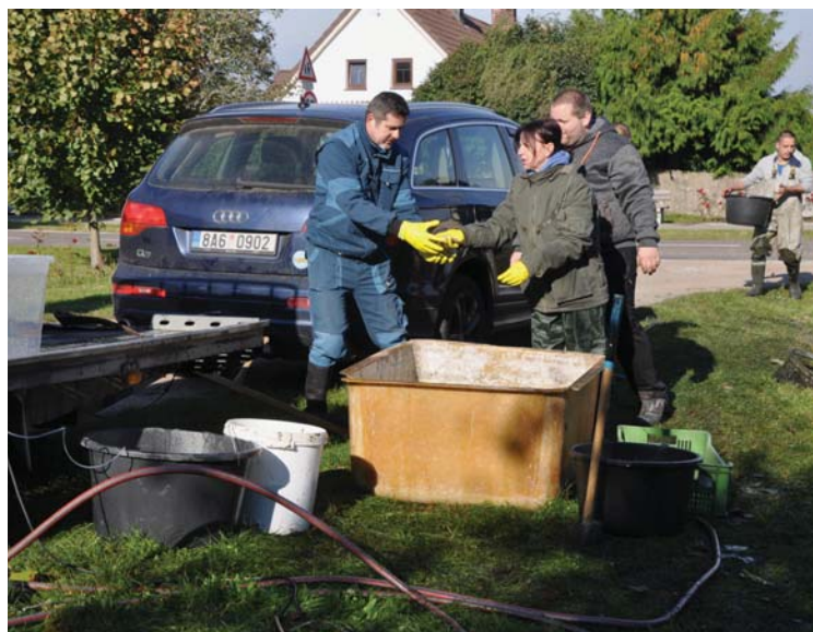
Vypuštění rybníka před velkou obnovou.