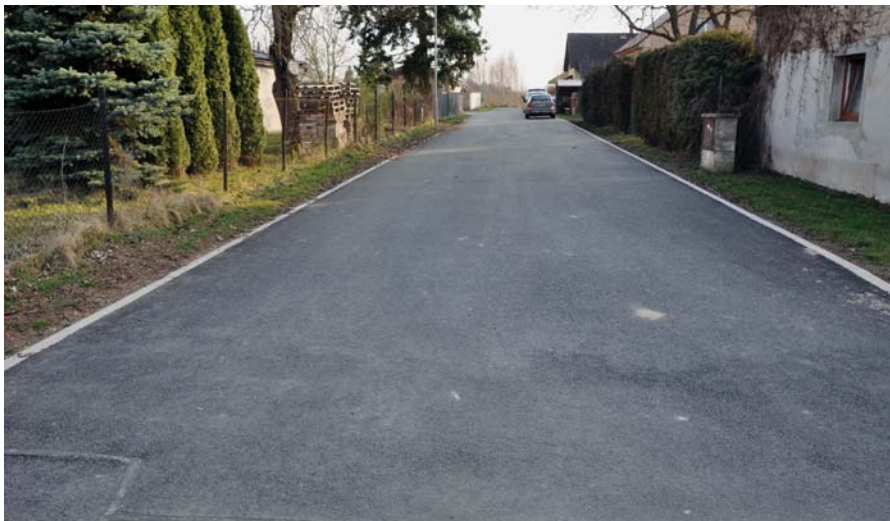
Nová místní komunikace na Švamberku.

Vlastními silami jsme recyklátem vylepšili také nedalekou polní cestu od první Křížovky ke druhé, tedy směrem k lesu, našemu přírodnímu rekreačnímu zázemí.