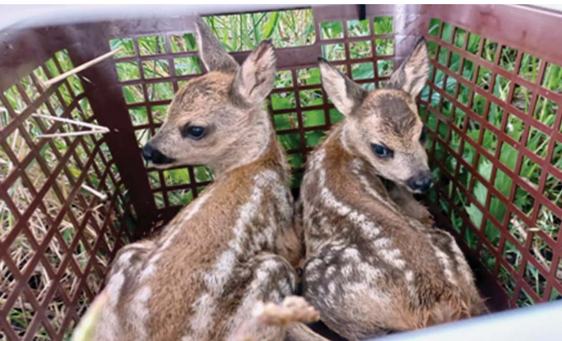
Odchyt srnčat před senosečí 2025.

pedagogice, ve které se snažíme probouzet a předávat myšlenku, že člověk je součástí přírody, v níž žije. A nadále se tomuto tématu budeme věnovat i v následujícím roce. Rádi bychom podporovali rozvoj a druhovou pestrost naší krajiny. Proto jsme v Rasoškách a na Novém Plese vysázeli v minulých letech aleje stromů, které zvyšují úživnost krajiny. Dalším projektům se nebráníme i na území obce Vlkova.