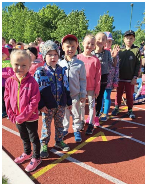
Nejmladší generace sokolů na PŽ v atletice.