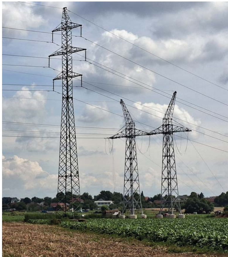
V první polovině roku dokončila u Vlкова společnost ČEPS kompletní rekonstrukci vedení V 453 Krasíkov – Neznášov.

Žádáme proto občany, aby box na textil nezahlcovali jinými nepotřebnými předměty z domácností. Kontejner má určitou kapacitu a v mezidobí mezi objednávkami vývozu a jeho vyvezením dochází k hromadění věcí okolo boxu.