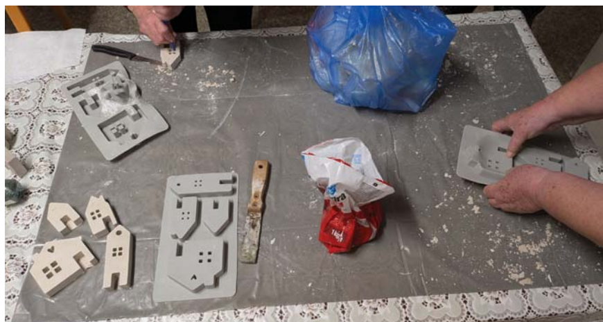
Výroba domečků ze sádry.