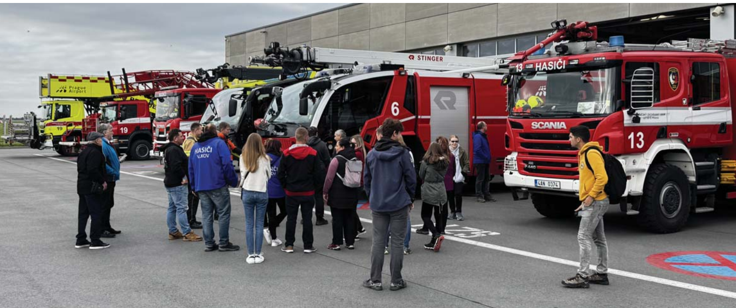
Vlkovští obdivovali hasičskou techniku.

O týden později 11. října nás čekal výlet do Prahy na Letiště Václava Havla, kde jsme mohli nahlédnout do zbrojnice tamních letištních hasičů. Pánové nás provedli kompletně celou budovou od garáže počínaje po dispečink konče. Rozdělili jsme se na dvě skupiny a každá se svým průvodcem za podrobného výkladu prošla celou služebnu. Měli jsme možnost nahlédnout a posadit se i do speciální techniky, se kterou se setkáte pouze na letišti. Po skončení velice zajímavé prohlídky nás po cestě zpátky čekal oběd a krátká exkurze v pivovaru Počernák.