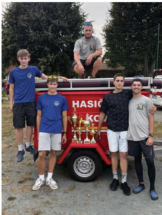
Vítězství na okrskových závodech v Jasenné.

Hasičská soutěž v Jezbinách 4. října pro nás byla posledním závodem sezony. Přes nepřízeň počasí a poměrně velkou účast závodních družstev jsme si nemohli přát lepší zakončení. A právě v tento moment bych se chtěl vrátit ke všem zmíněným závodům za uplynulý rok a seznámit vás s výsledky, které v naší soutěžní historii nemají obdoby. Troufám si tvrdit, že to byla nejúspěšnější sezona sboru vůbec.