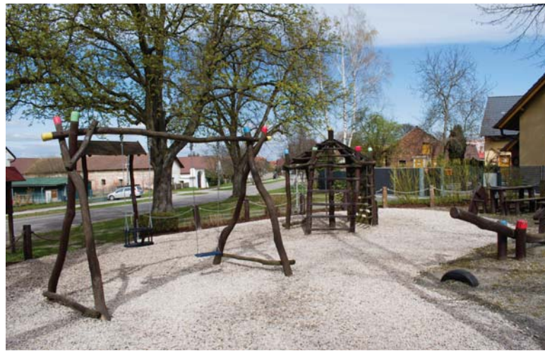
Důkladné rekonstrukce se v roce 2025 dočkalo i dětské hřiště na návsi.

A vám, milí vlkovští sousedé a přátelé obce, přeji nejprve pěkné čtení a prohlížení a pak již jen samá radostná setkávání v naší vesnici v roce 2026.