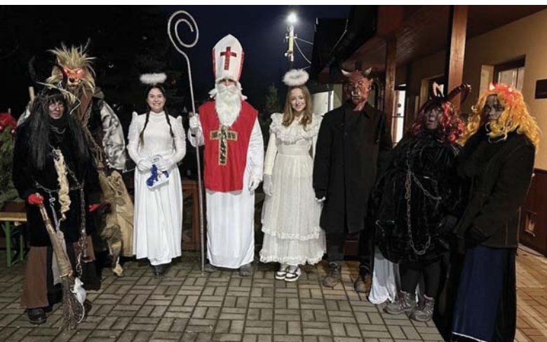
Mikuláš se svým doprovodem.

Dne 24. října přišla smutná zpráva, že nás nečekaně opustil nejdéle sloužící člen hasičského sboru ve Vlko- vě, bratr Václav Uždil. Důstojně jsme se s ním naposledy rozloučili 4. listopadu.