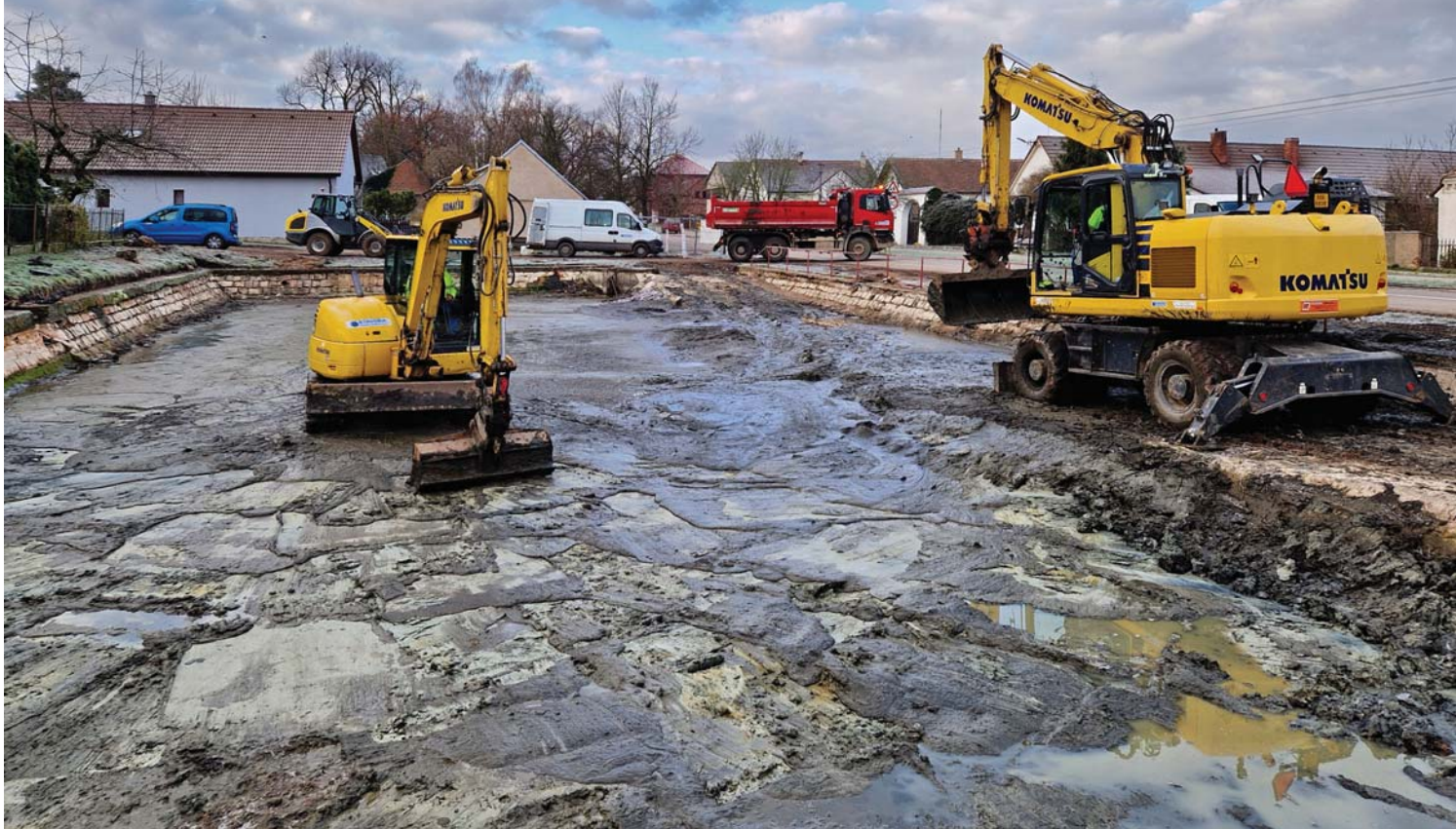
Rybník na návsi čeká velká proměna.