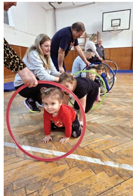
Cvičení nejmenších dětí.