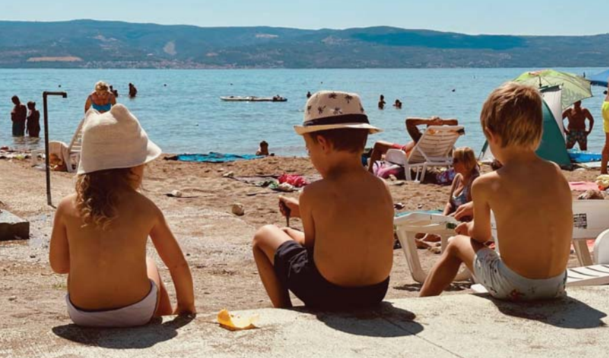
Mladí sokolíci v Duče.