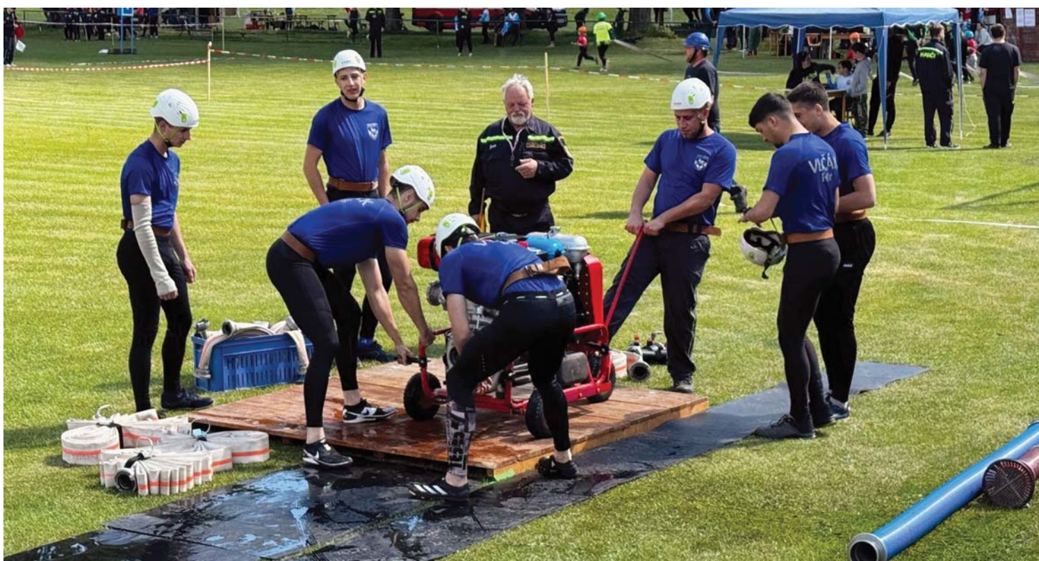
Příprava základny v podání Vlčáků.